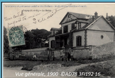
Vue générale, 1900