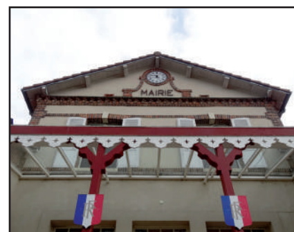
Fronton et porche, 2016

Aujourd'hui , l'édifice demeure bien conservé tant dans son architecture originale avec son porche et son jeu de toiture que dans l'organisation intérieure qui n'a pas beaucoup changé. La salle à manger de l'instituteur a été transformée en secrétariat de mairie et l'étage entièrement dévolu aux services municipaux. Poigny est l'une des rares communes du Parc à avoir maintenu cette double fonction au sein de l'édifice d'origine, qui va bientôt fêter ses 150 ans d'existence.