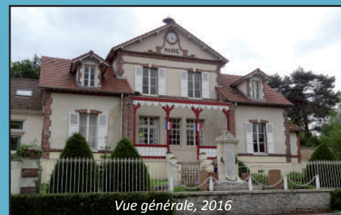
Vue générale, 2016

Architecte : Dubois Date de construction : 1868 Adresse : 1 place Maurice Hude Fonction actuelle : mairie-école