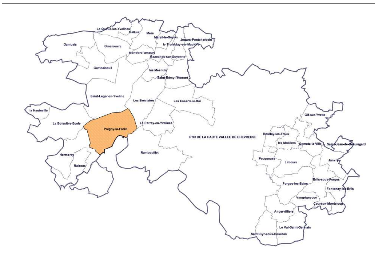
Localisation de Poigny-la-Forêt par rapport au PNR et aux autres communes favorables à leur rattachement – Kargo 2008