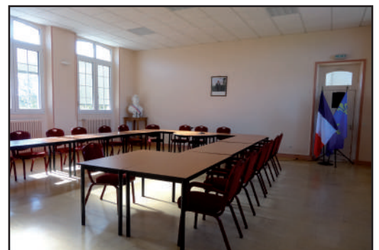
Salle du conseil, 2016