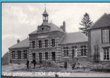
Vue générale, 1904