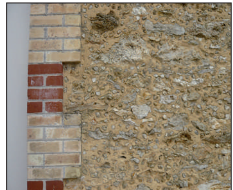
Détail du mur, 2016