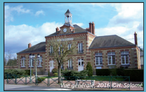
Vue générale, 2016

Architecte : E. Toubeau Date de construction : 1904 Adresse : 12 route du Haras Fonction actuelle : Mairie