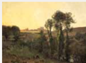
Les Vaux de Cernay, Léon-Germain Pelouse

Avec l'arrivée du chemin de fer, pendant la seconde moitié du XIX e siècle, de nombreux peintres viennent chercher l'inspiration dans les paysages du Parc, notamment ceux des Vaux de Cernay. Ils seraient plus de six cents à avoir délaissé leur atelier pour peindre directement en extérieur, sur le motif. À côté de peintres peu connus, on retrouve