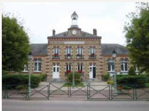
Mairie-école des Bréviaires

À partir du XIX e siècle, une série de lois encouragent la construction d'édifices scolaires et de mairies. Dans les petites communes, souvent, un même bâtiment sert à la fois d'école et de mairie. Le modèle le plus connu est celui d'un corps central, destiné à la mairie, flanqué de deux ailes accueillant l'école, l'une pour les filles, l'autre pour les garçons. L'ancienne mairie-école de Saint-Rémy-lès-Chevreuse, construite en 1880 par l'architecte Charles Brouty, est conforme à ce plan.