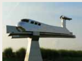
Maquette de l'aérotrain

Dans les années 1960, Gometz-la-Ville voit apparaître une nouvelle technologie : l'aérotrain, une machine qui devait se déplacer sur coussin d'air. Une voie expérimentale est construite en