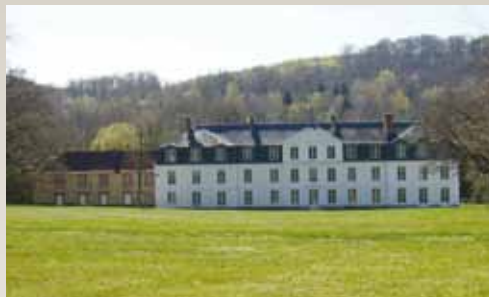
Château de Mauvières à Saint-Forget

Pendant la seconde moitié du XVIII e siècle, la redécouverte de Pompéi et d'Herculanum fait naître le néoclassicisme. On recherche l'harmonie des formes et des proportions, et on utilise des éléments