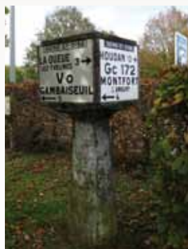
Borne Michelin à Grosrouvre

Néanmoins, quelques-unes sont encore visibles dans certaines communes du Parc comme à Choisel, Bullion, Rochefort-en-Yvelines et Grosrouvre.