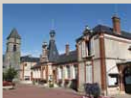
Mairie-école du Perray-en-Yvelines