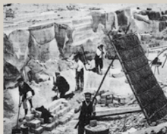
Carrière de grès