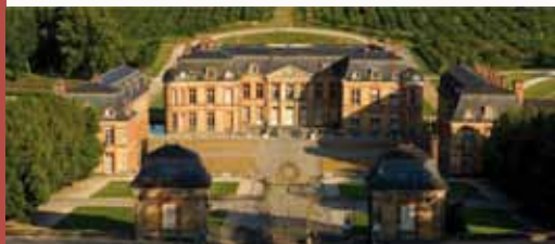
Château de Dampierre

Au XVII e siècle, le style Louis XIII s'affirme. Il se caractérise notamment par le contraste des matériaux, brique, ardoise et pierre, à Breteuil, Dampierre, la Celle-les-Bordes ou encore aux Mesnuls.