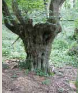
Arbre-borne dans la forêt de la Madeleine