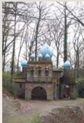
Skit du Saint-Esprit au Mesnil-Saint-Denis

Le terme « skit » vient du mot « scété » qui désigne une partie du désert d'Égypte où Saint-Macaire créa, au IV e siècle, une première communauté de moines vivant en retraité.