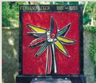
Tombe de Fernand Léger

ra E. Rostand, au château de Mauvières à Saint-Forget ; Jean Monnet, père de l'Europe, à Bazoches-sur-Guyonne ; Fernand Léger, à Gif-sur-Yvette pour n'en citer que quelques-uns !