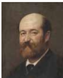
Portrait de Léon-Germain Pelouse, Fernand Cormon

Leurs œuvres, représentant leur vision de la nature, ont contribué à conforter la peinture paysagiste et à faire connaître la vallée de Chevreuse.