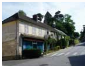
Auberge de chasseur à Grosrouvre

La ligne va rencontrer un tel succès que certains dimanches, on doit refuser des voyageurs. Néanmoins, l'exploitation du tronçon entre Saint-Rémy-lès-Chevreuse et Limours, peu rentable faute d'avoir