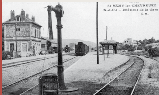
Gare de Saint-Rémy-lès-Chevreuse, au début du XX e siècle.

À partir de la seconde moitié du XIX e siècle, le chemin de fer apparaît dans la vallée de Chevreuse. La ligne de Sceaux, partant de Denfert-Rochereau, est inaugurée en 1846. Elle connaît plusieurs prolongements successifs jusqu'à Orsay en 1854 puis jusqu'à Limours via Saint-Rémy-lès-Chevreuse en 1867. Jusqu'en 1893, la ligne utilise un système innovant : le système Arnoux, qui permettait de réduire l'usure des rails et des roues ainsi que d'améliorer la vitesse du train, notamment dans les virages.