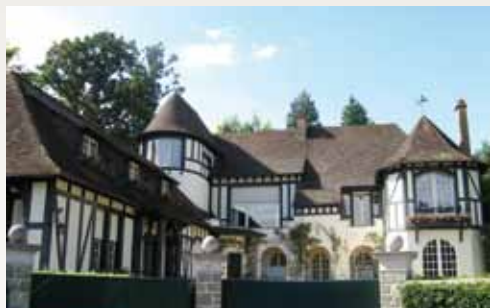
Villa néo-normande à Poigny-la-Forêt

Le néo-régionalisme a vu le jour dans les années 1860 à Houlgate sous l'impulsion de l'architecte Jacques Baumier. Diffusé depuis les stations balnéaires, le style néo-normand se caractérise par des toits imbriqués, asymétriques débordants et à croupes, par de nombreux oriels (avancées en encorbellement aménagées sur une façade) mais aussi par des lucarnes, de faux pans de bois et de hautes cheminées de briques.