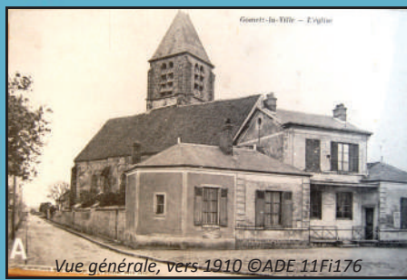
Vue générale, vers 1910