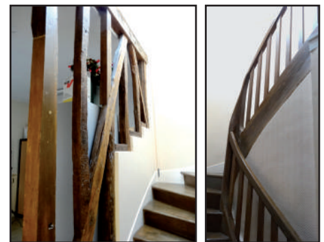
Escalier d'origine menant aux chambres, 2016

Aujourd'hui , malgré la réfection des enduits, la fermeture du perron par un vestibule vitré, l'extension récente de la salle municipale par une véranda, le bâtiment a été relativement bien conservé. L'organisation des espaces intérieurs n'a pas changée, à quelques cloisons près. La salle de mairie est devenue le secrétariat, la classe est devenue salle du conseil, et l'extension du logement de l'instituteur constitue le bureau du maire. L'escalier permettant de monter à l'étage reste l'élément intérieur le mieux conservé.