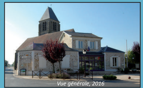
Vue générale, 2016

Architecte : Dubois Date de construction : 1860 Adresse : Place de la mairie Fonction actuelle : mairie