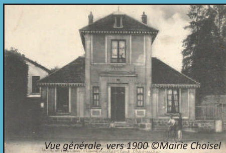
Vue générale, vers 1900