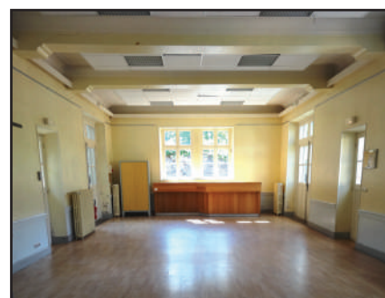
Ancienne salle de classe avec ses poutres, 2016

Aujourd'hui , le bâtiment a très peu changé en apparence, malgré quelques modifications parmi lesquelles le déplacement de l'escalier et la création d'une passerelle extérieure. Les clôtures, les portails et la cour de récréation à l'arrière sont toujours visibles, le préau des filles ayant été muré et surélevé.