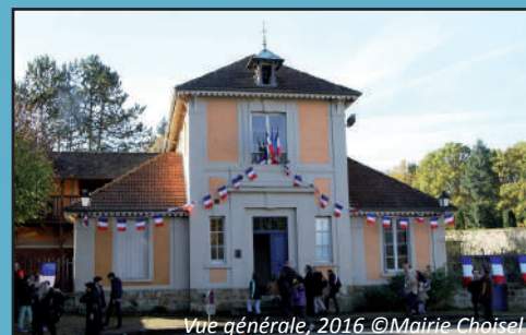
Vue générale, 2016

Fonction actuelle : maison des associations