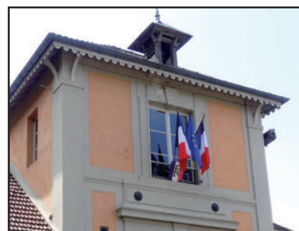
Porte-drapeau, lambrequin et clocheton, 2016

La mairie-école est bâtie en pierre de meulière recouverte d'un enduit décoré d'éléments en plâtre qui mettent notamment en valeur la porte d'entrée. Elle se compose d'un long bâtiment à un étage dont le pignon, flanqué de deux petites ailes basses, donne sur la place. Son toit en tuiles se distingue par ses quatre pans (trois pour les ailes) soulignés d'un fin lambrequin en bois, tandis que la façade principale est couronnée d'un clocheton à girouette. Le vestibule d'entrée donne accès à trois espaces. Dans l'aile gauche se trouvent le cabinet de l'instituteur et le secrétariat de mairie, le maître d'école étant souvent aussi secrétaire du maire. Dans l'aile droite se situe le logement de l'instituteur. Au centre, la salle de classe se profile dans le prolongement du hall d'entrée. Les élèves y accèdent par les deux portails latéraux situés côté place. Bien qu'elle soit mixte, l'école de Choisel comporte deux cours distinctes accessibles de part et d'autre de la salle de classe, chacune disposant d'un préau. A l'étage, accessible par un escalier situé dans le vestibule d'entrée, se trouvent la salle de la mairie au-dessus de l'école et un cabinet des archives.